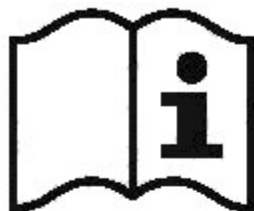
Рисунок 3 — Пиктограмма

а) пиктограмму для указания на то, что пользователь должен прочитать информацию, сообщаемую изготовителем (см. рисунок 3);