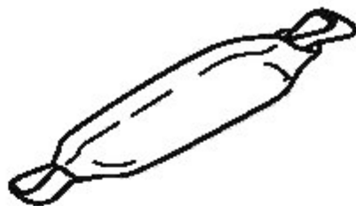
Рисунок 1 — Пример амортизатора как компонента